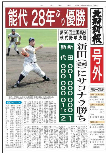
右:7年前の全国優勝を報じる北羽新報の号外

左の写真は一昨年度全国大会で準優勝した際に撮影した写真です。左下の写真は6年前のエースの写真です。右下の写真は7年前に全国優勝したときの新聞記事です。